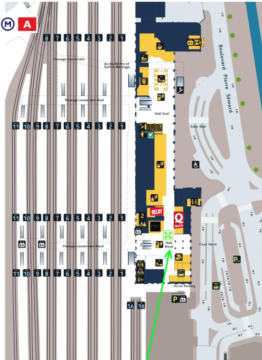
Point de rendez-vous